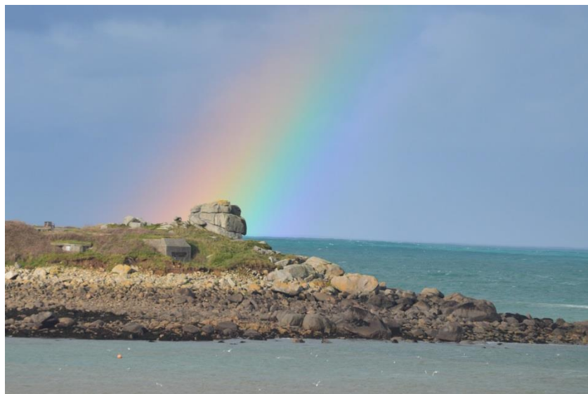
Départ: Rocher du Lion